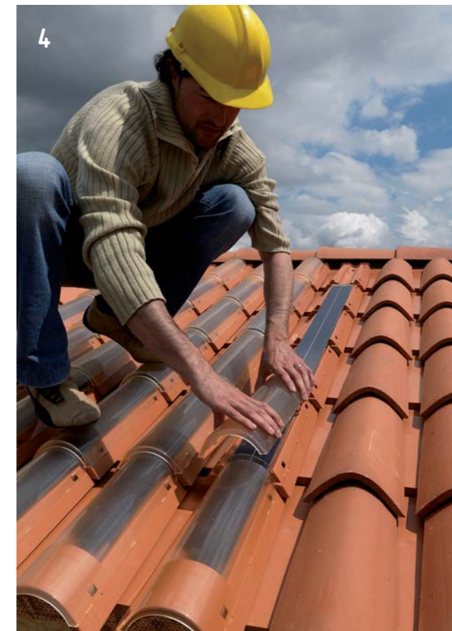
4 Protezione del modulo con gli appositi vetri di copertura