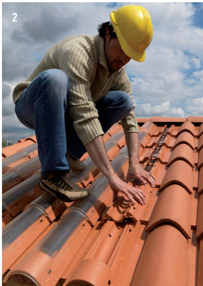
2 La posa del corpo tegola Easy avviene mediante incastri