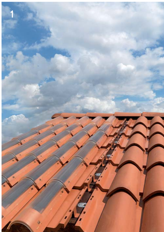
1 Il tetto predisposto per l'installazione