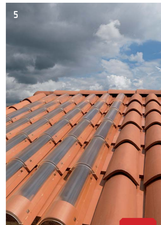
5 Techtile Easy è montato

Il collegamento elettrico di Techtile Easy ai quadri elettrici del vano tecnico si effettua come quello di un tradizionale impianto fotovoltaico.