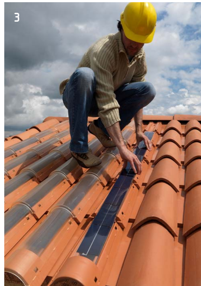
3 Innesto del modulo Easy sulla fila di tegole